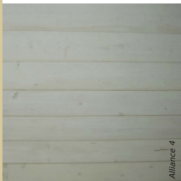
Blanche ou colorée, la lasure teinte le bois tout en laissant apparaître ses veines.