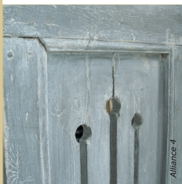
Lasure sur volet ancien : La peinture ancienne est brossée, le bois mis à nu absorbe la lasure et les zones déjà peintes sont juste éclaircies.

Lorsque la lasure est sèche, la protéger avec une cire, de l'huile dure ou un vernis.