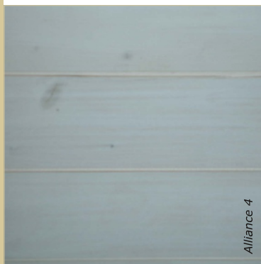
La lasure s'applique notamment sur un lambris.