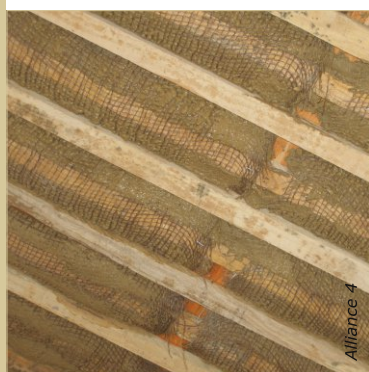
Une toile de jute peut être tissée entre les lattes pour faciliter l'application de la première couche de mortier d'argile.

Les plafonds en briques plâtrées, en lattis recouvert d'enduit ou en maçonnerie sont les meilleures solutions. Le caractère monolithique de ces parements assure l'étanchéité aux flux d'air, maintient la perspirabilité du bâti et renforce l'isolation phonique vers l'extérieur. Les étanchéités maçonnées présentent une très bonne durabilité et sont d'excellents régulateurs hygrométriques.