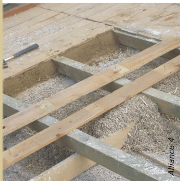
Alterner remplissage isolant et clouage de la volige.