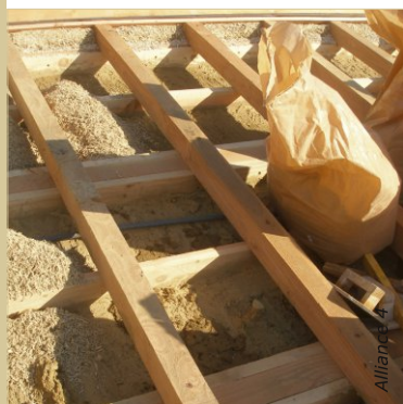
Déverser une première couche d'isolant puis la tasser. Soigner le remplissage sous les chevrons.