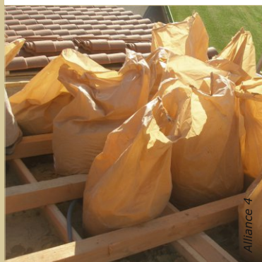
Le chanvre stabilisé peut être mélangé sur chantier ou commandé prêt à l'emploi.

Voir fiche : Matières et matériaux -> Matériaux -> Chanvre stabilisé