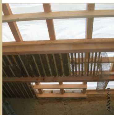
Une bâche provisoire est mise en place. La pose du lattis et de la première couche d'enduit se fait ainsi par l'intérieur à l'abri des intempéries.