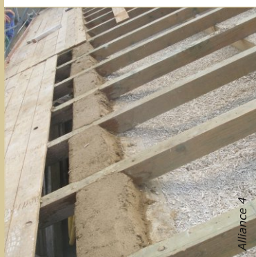
Les arases de ce mur en pisé sont réalisées avec un béton d'argile avant remplissage.

Progresser et alterner remplissage et clouage de la volige, contrôler le tassage.