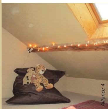
L'enduit à l'argile sur lattis fournit un bon confort d'été et maintient la chaleur en hiver par une parfaite étanchéité à l'air.

VOUS TROUVEREZ CHEZ ALLIANCE 4 TOUS LES PRODUITS POUR VOTRE RÉALISATION : FILASSE ET OUATE DE CHANVRE, CHÈNEVOTTE, CHAUX, SABLE DE PONCE, ARGILE, PLÂTRE, ETC. VOUS TROUVEREZ LE CATALOGUE COMPLET SUR WWW.ALLIANCE4.FR