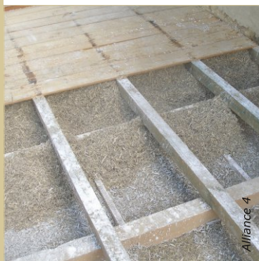
Répartir l'isolant dans tous les recoins. Ici le remplissage est fait par voie semi-humide en chanvre stabilisé.